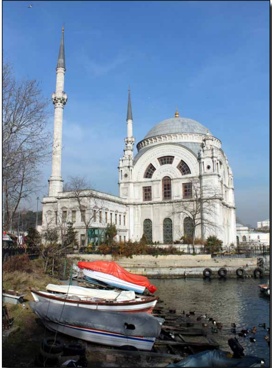
Dolmabahçe, Bezmialeml Valde Sultan Camii.