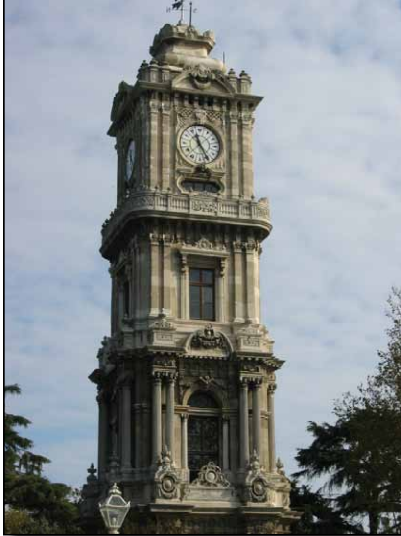
Dolmabahçe'deki saat kulesi.

mebşûre (onuncu güzel kadın) isimleri yazılıdır. Dolmabahçe ile Kabataş arasında ve yokuşun başında pek sade bir şekilde yapılmış bir çeşme üzerinde yazılı tarih aşağıdadır: Pâdişâh-ı dîn-ü devlet hazret-i Abdülhamid Taht-ü baht-ü şevketin sultân-ı sâhib-i efsûn Ser-be-ser sîrâb-ı âb-ı cûyu cûd-i kâinât Ser-be-ser doldurdu sît-ü adli ile keşveri