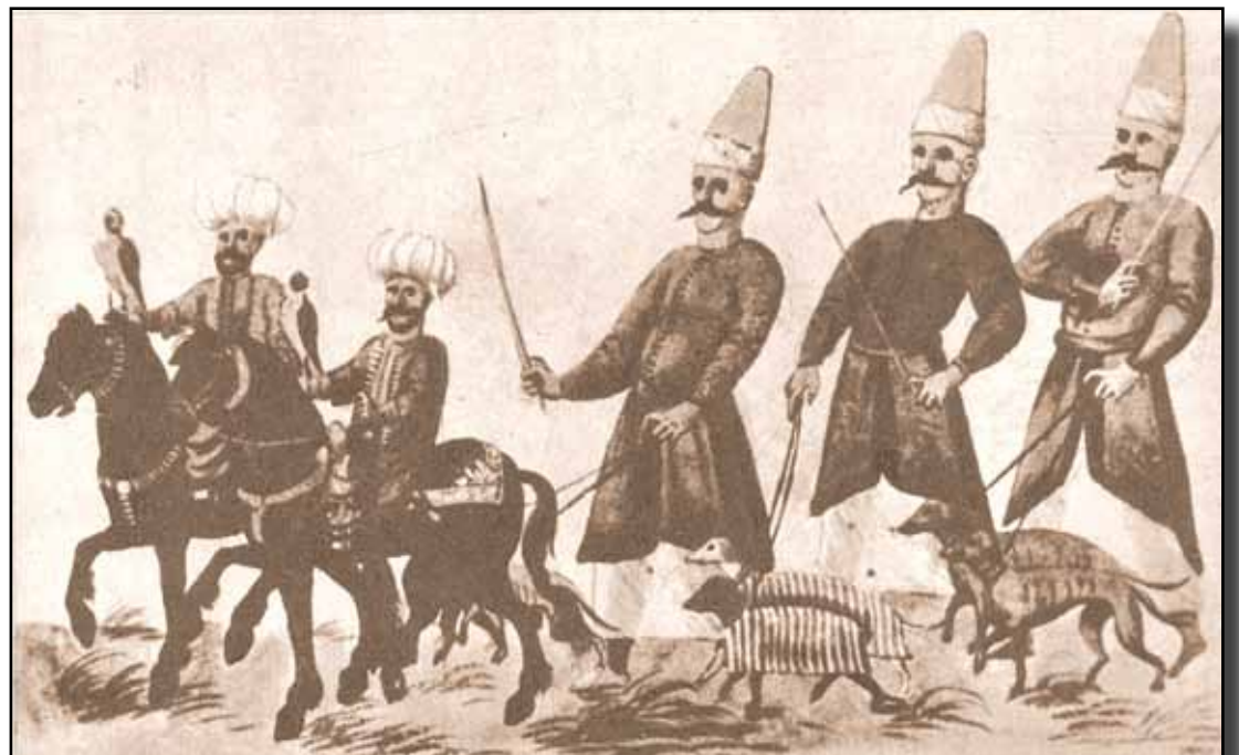
Doğancı ve zağarcılar bir avda.

Doğancıbaşı her av getirişinde ayrı bahşiş alır, ava çakırcıbaşı ve şahincıbaşı ile çıkardı. Doğancıbaşlardan mirâhûrluğa (saray ahır görevlisi), sancakbeyliğine, beylerbeyi ve vezirliğe kadar yükselenler olurdu. Taşrada bu kuşların bakımıyla görevli olanlar da çeşitli adlar alırlardı. Bunların başlıca görevleri sarayın ihtiyacı olan çakır, şahin, atmaca yuvalarına bakmalar, yuvacı ve yavrucu denilen bu görevliler, kuş yavruları kanatlandıktan sonra bunları götürücüler aracılığıyla İstanbul'a getirir doğancıbaşıya verirlerdi. Bunların kimi de avcılık yaparlardı. Dışarlıklı av-