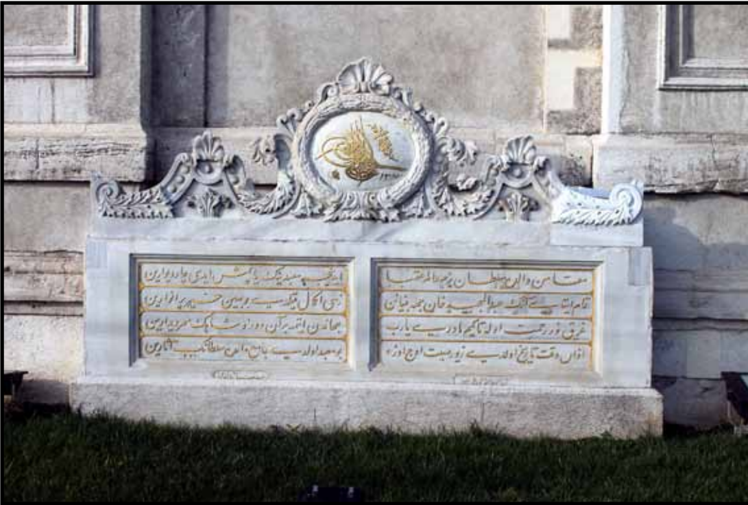
Bezmialem Valde Sultan Camii kitabesi.

Karşısında Gâzî Sultan Süleyman Han'a rica ile Beşiktaş yakınında, Süleymâniye Câmii'ni yaptıran Bektâşi