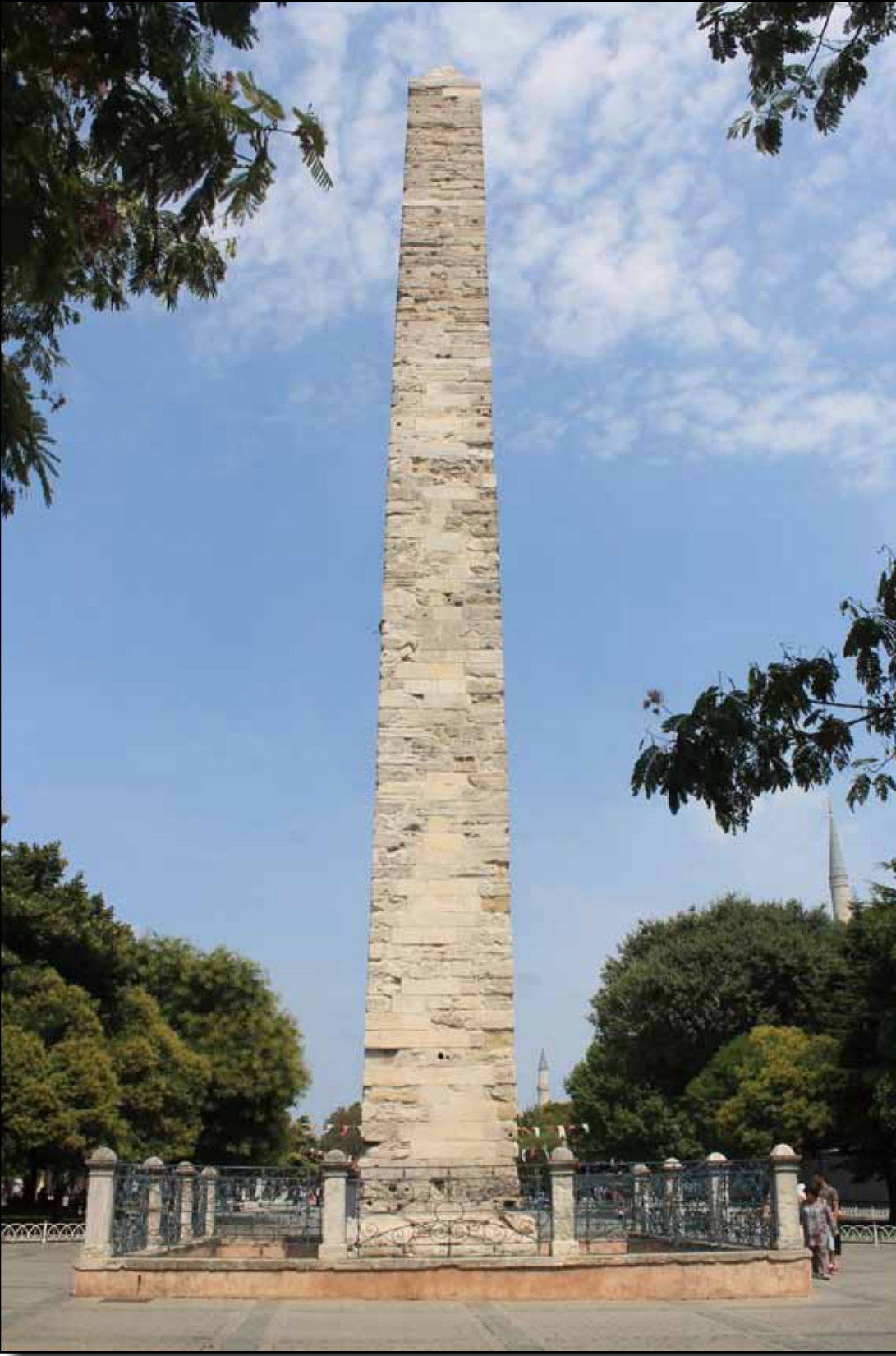
Örme sütun (Mıknatıslı Sütun)