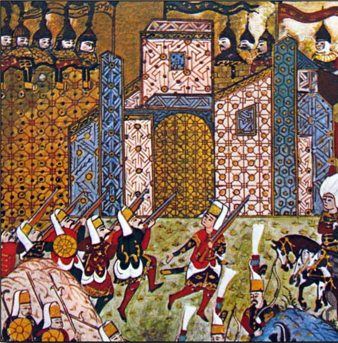
Kanuni Rodos'u fethederken.