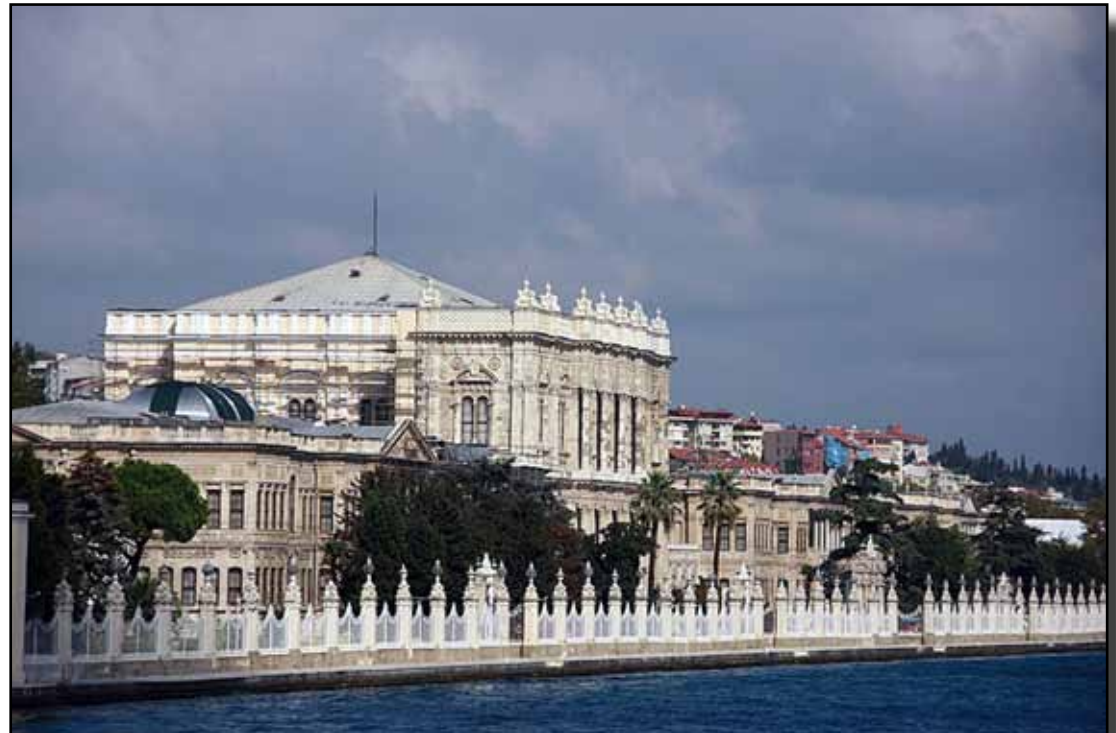
Dolmabahçe Sarayı'nın denizden görünümü.

Dışarı kaynayan, toprağın sınırsız bahşet- tiğini