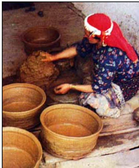
Elle bir çömlek yapımı.

MÖ. 3000 yıllarında çarklı çömlekçiliğin kuzey Mezopotamya'dan tüm Mezopotamya'ya, batı Hindistan'a, Suriye'ye, Mısır'a ve Önyasya'ya yayıldığını gene arkeolojik kazıların yardımıyla izleyebiliyoruz. Anadolu'da ilk çarklı çömlekçiliğe ait bulgulara MÖ. 3000-2000 yılları arasında ilk kez Kayseri dolaylarında, Alişar'da, Boğazköy'de ve Truva'da raslanıyor.