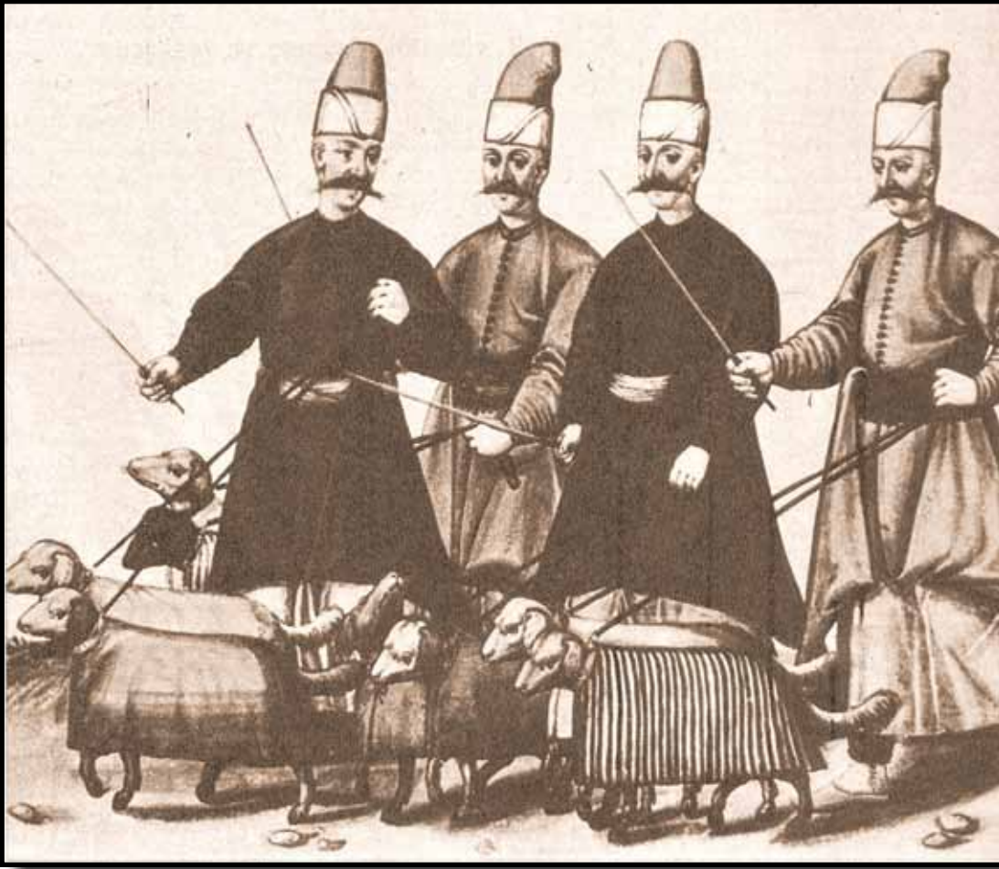
Hezaren değnekli zağarcılar.

cılar da, vaşak, tilki, çakal, kaplan, zerdüva, sansar, ayı gibi avladıkları hayvanların postlarını her yıl ağalar aracılığıyla saraya ulaştırırlardı. Taşrada bulunan ve deftere kayıtlı bu av görevlilerinin, kayacı, şahin tuzakçısı, görücü gibi çeşitleri vardı. Saray içinde doğancı koğuşuna hâne-i bâzyân denilirdi, başları doğancıbaşıydı. Bunlar, kaftanlı enderûnlulardı. Doğancılar yeşil kavuk giyer, üzerinde üç etek, lâcivert şalvar, kırmızı yemeni giyerlerdi. Doğancıbaşı ise günlük giyiminde sivri külah, cüppe, mintan, dökme şalvar, san yemeni, tören günlerinde ise başta üsküf, donluk şal, san erkân kürkü giyerlerdi. Bunun gibi zağarcıbaşı, çakırcıbaşı, çakırcı, çakır salan, sahincıbaşı, şahinci, atmacıbaşı, atmacacı gibi şikâr ağaları ve şikârîlerin ve gürenççi, götürücü, bazhane mülâzımı, yuvacı, yavrucu, şahin kayacı gibi çeşitli av görevlilerinin birbirlerinden ayrılan giyim kuşamları vardı.