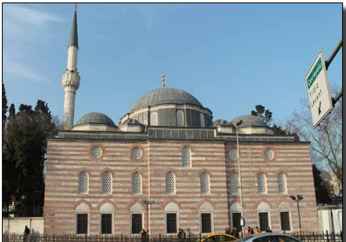
Beşiktaş, Sinan Paşa Camii.