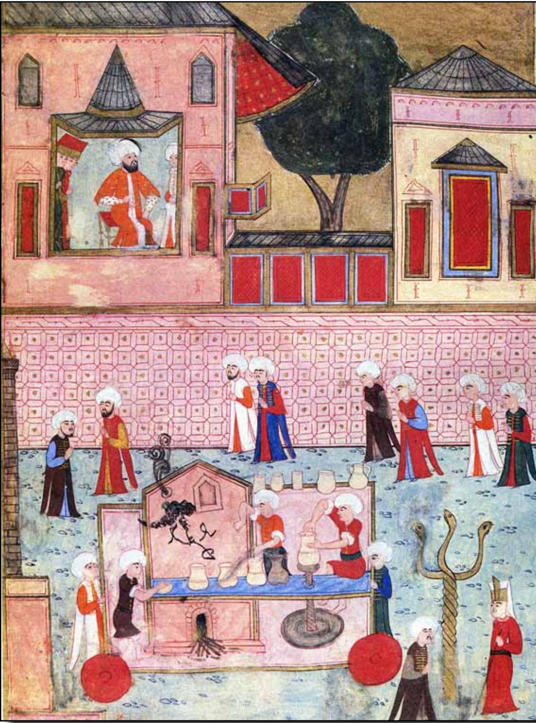
Sultan III. Murat devrinde şehzadelerin sünnetinde çömlekçiler minyatürü.