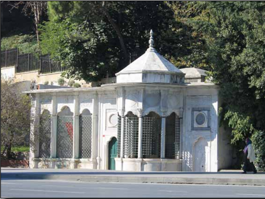
Dolmabahçe'de bir sebil-çeşme.