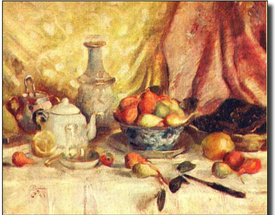
Feyhaman Duran'ın bir tablosu.

Kısaca en değerlilerini saydığımız bu ressamların her yılın ağustos ayında Galatasaray lisesinde tertipleedikleri sergiler İstanbul halkına alışılmamış cesaret ve alıcılıkta bir resim ziyafeti sunuyordu. Empresyonizm, açık hava ressamlığı, portrecilik, büyük çapta düzenlemeler Türk resim sanatını yepyeni bir havaya kavuşturuyordu. Benzetilmiş insan resmi Çallı, Feyhaman, arasıra Namık İsmail eliyle sanatımıza girmiş-