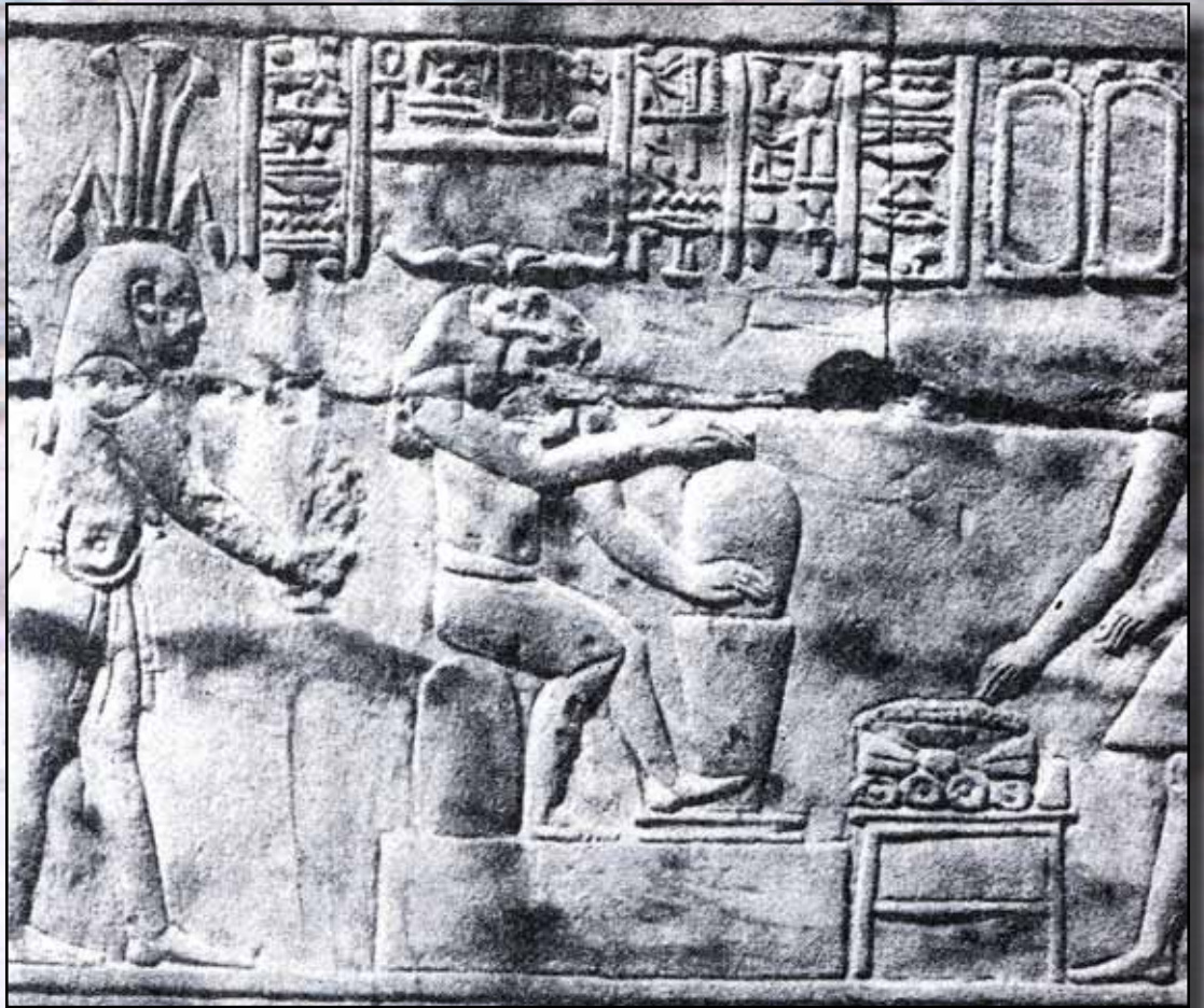
Bir Mısır tapınağındaki kabartmada çömlek yapımı.

bilelerinde görülebilirdi. Örneğin, Berdamos kabilesi kilden kapkacak yapmayı kısa bir süre önce kültür bakımından kendilerinden ileri bir kabile olan Hereroslar'dan öğrenmişlerdir. Böylece çömlekçilik sanatı komşuluk ilişkileriyle ilerlemiş kültürlerden geri kalmış kül-