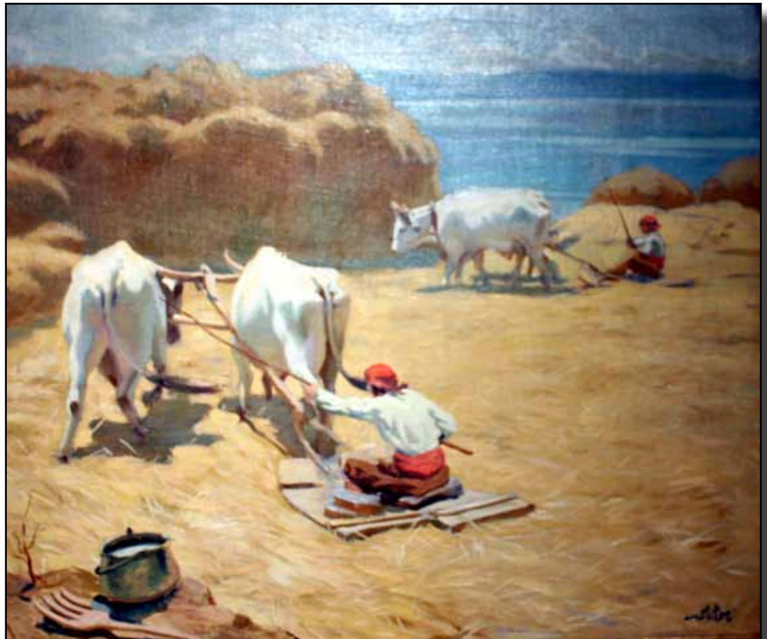
Namık İsmail'in Harman isimli tablosu.

1928-1933 yıllarında ortaya atılan genç topluluklar, Atatürk devrimlerine uyan bir resim ve heykel sanatının doğmasına yardımcı olmaya çalışıyorlardı. Bu arada Refik Epikman, Cevad Dereli, Şeref Akdik, Hâle Âsaf, Hadi Bara ve Zühtü Müridoğlu, Cemal Tollu, Nurullah Berk, daha sonraları Bedri